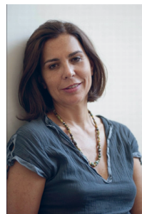
Francesca Comencini (Roma, 1961).

Gina y Marco viven en los suburbios de Roma. Ambos se conocen en un día muy especial: su primer día de trabajo. Un futuro prometedor les espera y parece al alcance de la mano. Gina está a punto de cumplir su sueño de convertirse en actriz, mientras que Marco encuentra por primera vez una oportunidad que le permite empezar a soñar: un trabajo en una compañía de alquiler de coches como conductor. Se conocen cuando el primer encargo de Marco es llevar a Gina a una cita, y, debido a un retraso, deben pasar el día entero juntos. Durante este día, pasarán de la periferia al centro de la ciudad y les servirá para comparar sus experiencias y pensar en un futuro que ya ha comenzado.